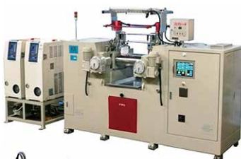
テスト用ロール機