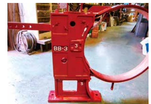
非常停止ブレーキ